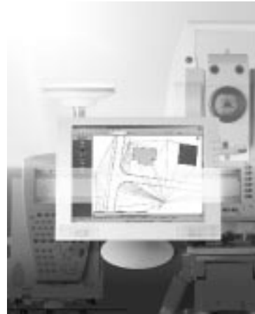
Abb.: LEICA GeoOffice

Die SmartStation von Leica Geosystems ist als Kombination von Tachymeter und GPS-RTK-Rover die logische Weiterentwicklung auf dem Markt der geodätischen Sensoren. Sowohl die Bedienung des Instruments und als auch die Datenspeicherung sind integriert in einer gemeinsamen Benutzerführung und einer einheitlichen Datenbank. Der Beitrag untersucht, ob mit einer solchen Instrumentenkombination Effizienzsteigerungen möglich sind.