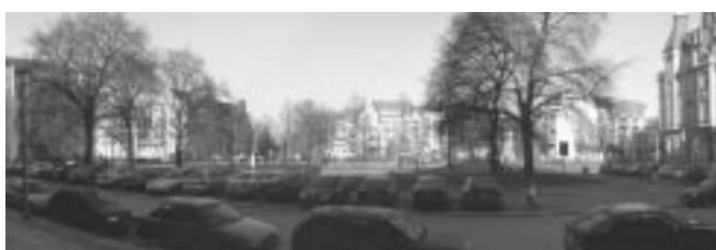
Abb.: Münchner Platz – Ansicht von Süd-Ost

Die Polaraufnahme des Testprojekts „Münchner Platz“ erfolgte mit einem Tachymeter vom Typ TCRP1203 der Firma Leica Geosystems. Dabei handelt es sich um einen vollmotorisierten, zielsuchenden Tachymeter mittlerer Genauigkeit. Die verwendete Version verfügte nicht über die RCS Fernsteuerung, so dass im klassischen 2-Mann-Verfahren mit einem Reflektorträger und einem Bediener am Instrument gearbeitet wurde. Während der tachymetrischen Einzelpunktaufnahme wurden insgesamt 410 Punkte von 4 Instrumentenstandpunkten aufgemessen. Die Gesamtmessdauer von 320 min setzt sich zusam-